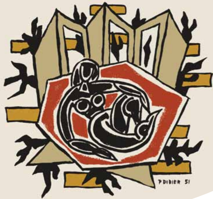
FEMME AU PATIO - 1951 - TAPIS EN LIN - 200 X 250

Dès 1949 et jusqu'au début des années 1960, l'artiste-peintre Pierre Didier réalise une importante série de maquettes et «cartons» destinés aux supports textiles.