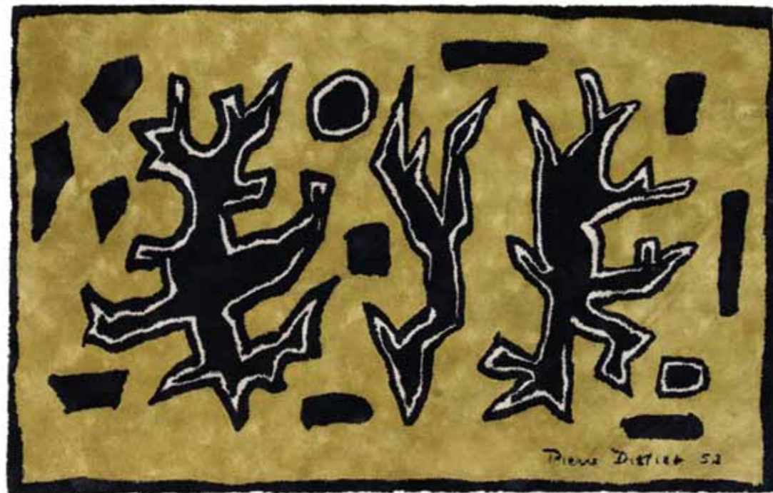
ARBRES ET LUNE - 1952 - TAPIS EN LIN - 172 X 290