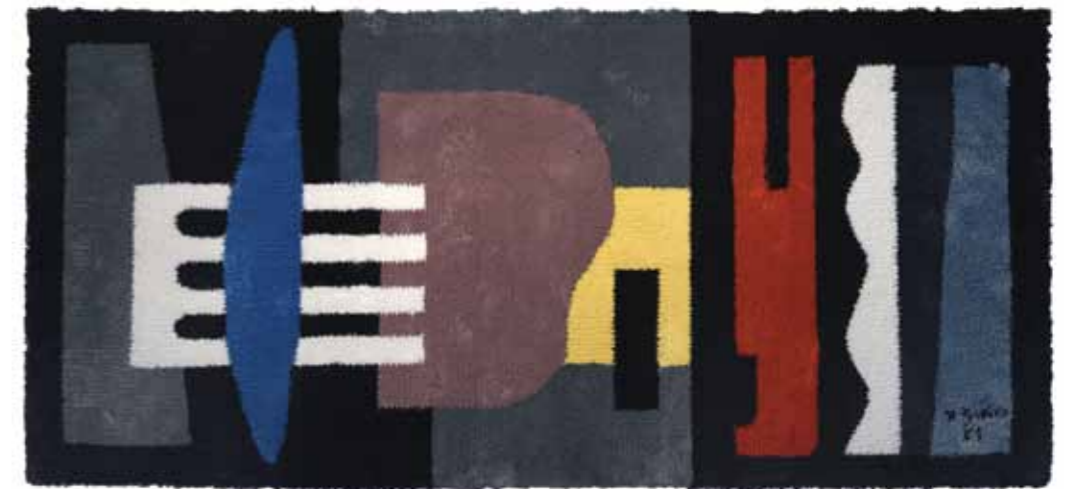
POINT CENTRAL - 1955 - TAPIS EN LIN 90 X 195