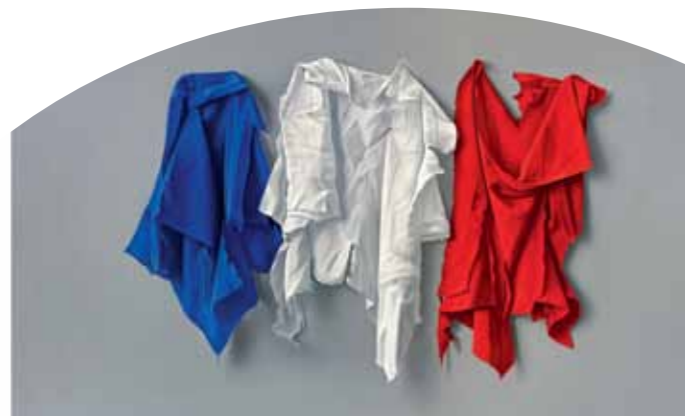
BLUE / WHITE / RED HUILE SUR TOILE - 2011 - 146 X 89